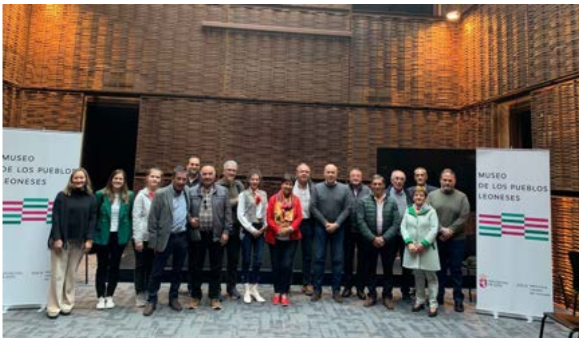
Reunión inicial para organizar el III Congreso Internacional. Mansilla de las Mulas, 29 de abril de 2024

Entidades organizadoras: Ayuntamiento de La Bañeza, Diputación de León, Instituto de Estudios del Órbigo, Instituto de Estudios Cabreireses y Federación leonesa de Antrujeos