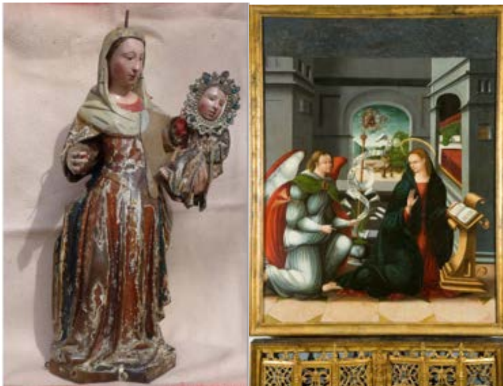
Fotografías de la Virgen de la Guiana (izquierda) y una Anunciación que formaba parte de un retablo de la Tebaida

Después de la exposición de las Edades del Hombre en su edición de 2024 (Villafranca del Bierzo-Santiago de Compostela) titulada Hospitalitas es de prever que esta exposición mantenga el interés por este tipo de muestras en la otra capital berciana, un año después.