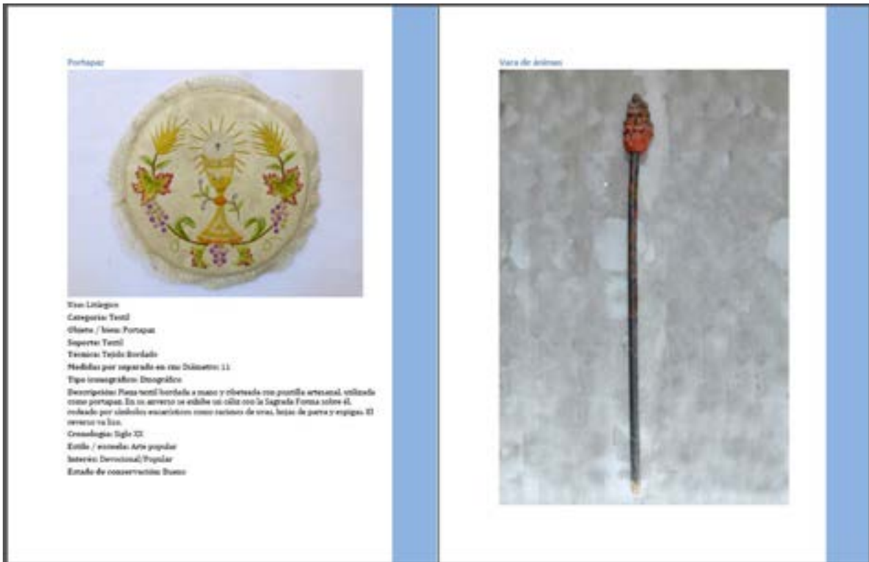
Dos páginas del volumen 5, correspondiente a San Esteban de Valdueza

El 16 de diciembre de 2023 se presentaron los volúmenes correspondientes a las siguientes localidades, con asistencia de autoridades y custodios: